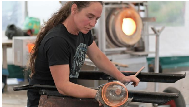
Beeld uit glasblaasdemonstratie 2021

Alle activiteiten kenden een hoog aantal deelnemers, feitelijk waren alle activiteiten volgeboekt. Het randprogramma voorziet in een duidelijke behoefte en wordt in komende edities zeker gecontinueerd.