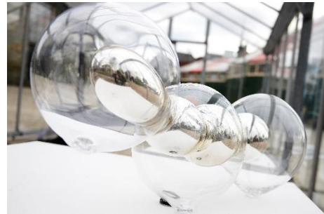
Een van de 25 geëxposeerde kunstwerken tijdens Glasrijk 2021.

De geëxposeerde glaskunstwerken van de editie 2021 blijven te bekijken op de glasrijkwebsite, klik hiervoor hier . Vanaf 2021 wil Glasrijk op deze manier een archief opbouwen van geëxposeerd werk.